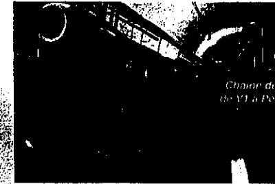
Chaise de montage de V1 à Peenemünde.

Des objets authentiques : témoignages des Alliés ou de l'Axe, les nombreuses pièces ont été sélectionnées dans le souci de rester rigoureusement fidèle à l'histoire sans basculer dans un fétichisme nostalgique.